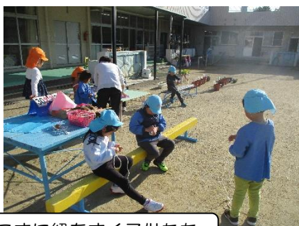
こまに紐をまく子供たち

3学期始業式の日から過ごしやすく暖かな日が続きましたので、子供たちは毎日戸外へ出て、2学期に遊んでいたサッカー遊びや鬼ごっこ、乗り物遊びを楽しみました。そのような中、新しい環境として正月遊びのこまや羽子板を用意すると「お正月に遊ぶものだね」と言いながら興味をもち、遊び始めました。何度も挑戦するうちに投げごまの要領をつかみ始める子供も見られるようになってきました。